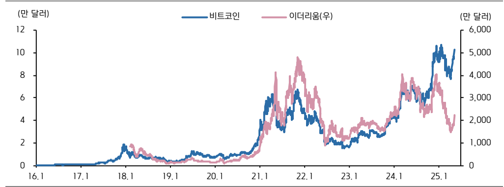
자료: Bloomberg, 키움증권 리서치