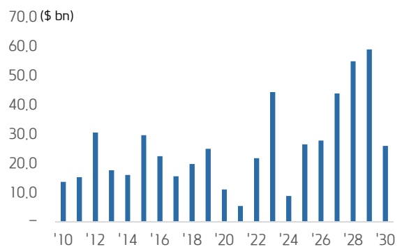
미국 특허만료 의약품의 매출